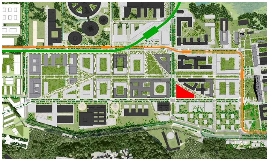
Emplacement du Lot C3.4 au sein du quartier de l'Ecole polytechnique