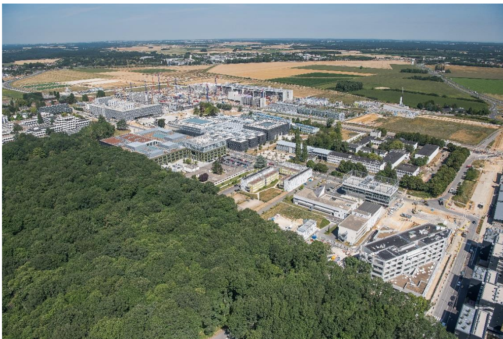
Vue aérienne du quartier de Moulon

Afin de poursuivre l'aménagement du Campus urbain Paris-Saclay, l'EPA Paris-Saclay organise une consultation auprès d'opérateurs et de gestionnaires sur le lot EE2 afin de réaliser dans le quartier de Moulon, à Orsay, un programme innovant de logements étudiants (300 lits) à haute qualité environnementale.