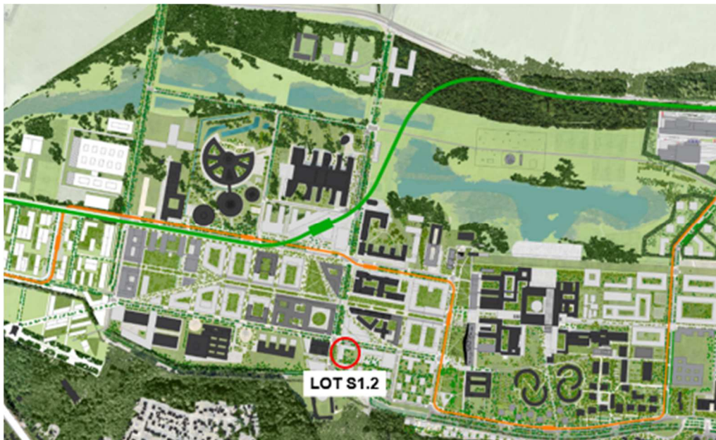
Emplacement du Lot S1.2 au sein de la ZAC du quartier de l'École polytechnique