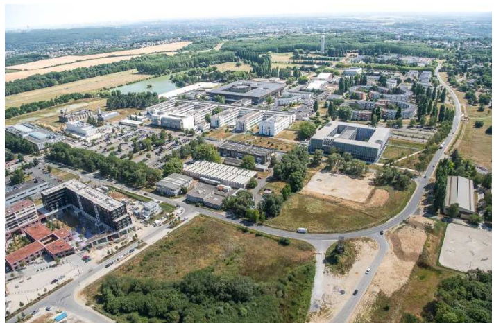
Vue aérienne du quartier de l'École polytechnique, Palaiseau

Les candidats accèdent ainsi à la phase Offre, dans laquelle ils doivent présenter une proposition programmatique, un modèle de gestion, ainsi qu'une offre financière.