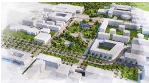
Vue aérienne

Au cœur du parc de Moulon se situe le bâtiment du .F , qui sera livré prochainement. Il sera le lieu d'animation incontournable du campus urbain en regroupant notamment un restaurant, un food-court, une salle d'exposition, un clubbing, des pop-up stores, ou encore un studio son et photos.