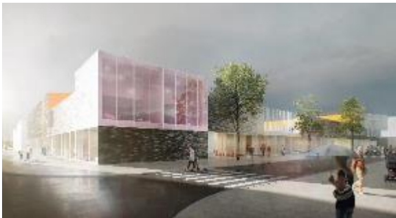
Le Groupe scolaire - Crédit : Dominique Coulon et associés

La pose de la première pierre du Groupe scolaire, ainsi qu'une visite du Parc de Moulon commentée par la maîtrise d'œuvre ont ainsi été organisées. L'occasion également d'évoquer le projet de lisière sur le campus urbain de Paris-Saclay, subventionné par ce programme.