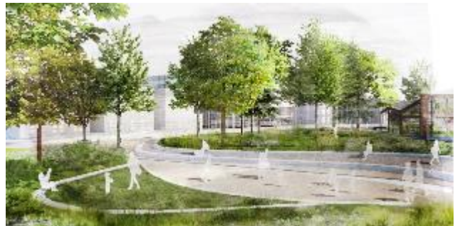
Le Parc de Moulon