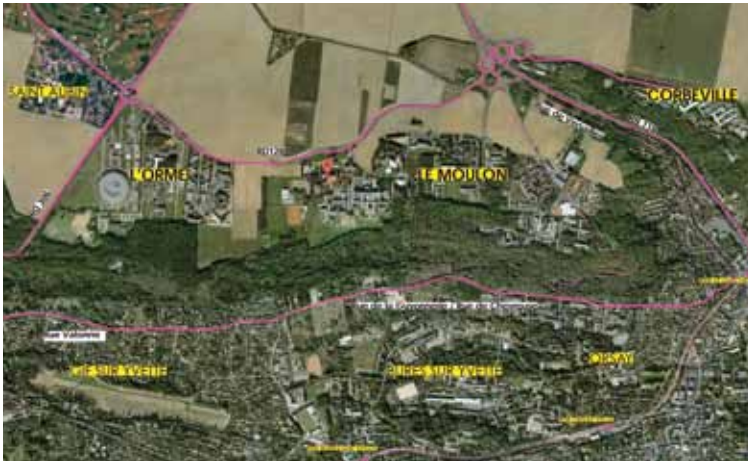
Le quartier du Moulon, un quartier bordé par un bois classé, des terres agricoles, des infrastructures routières

Le projet de quartier du Moulon concerne les communes d'Orsay, de Gif-sur-Yvette et de Saint-Aubin. Délimité par la RD306 à l'Ouest, la RN118 à l'Est, la rigole de Corbeville au Nord et les coteaux boisés au Sud, le site est composé de deux ensembles, le plateau du Moulon proprement dit et le secteur de l'Orme des Merisiers.