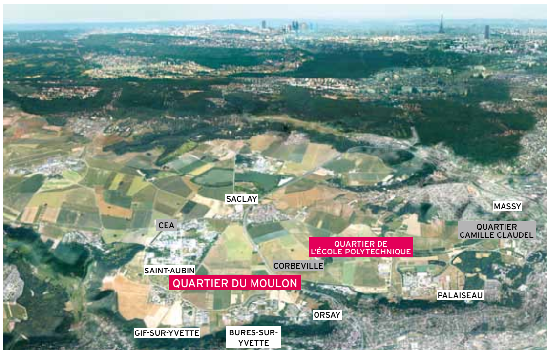
Le sud du plateau de Saclay

Le projet de quartier du Moulon s'inscrit dans une vision pour l'aménagement du sud du plateau. L'objectif est de favoriser l'émergence d'un parc-campus de Saint-Aubin à Palaiseau, rassemblant science, activités, habitat et services.