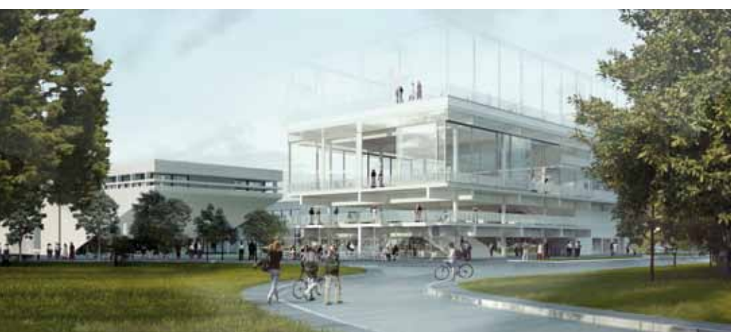
Première réalisation dans le cadre du projet, le « Lieu de vie » illustre ses principes. Ce bâtiment compact offrira une variété de services (restauration, terrain et salle de sport, espace culturel) ouverts à tous.

Au vu des potentialités et des faiblesses de l'actuel quartier du Moulon, plusieurs orientations ont été privilégiées pour répondre aux grands enjeux du projet Paris-Saclay.