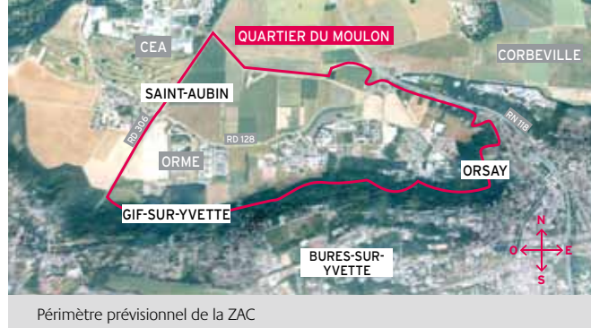
Périmètre prévisionnel de la ZAC

Dans le cadre du développement d'un pôle scientifique et technologique d'envergure mondiale, l'Etablissement public Paris-Saclay a pris l'initiative, avec les communes de Gif-sur-Yvette, Orsay et Saint-Aubin, d'une zone d'aménagement concerté pour développer le quartier du Moulon.