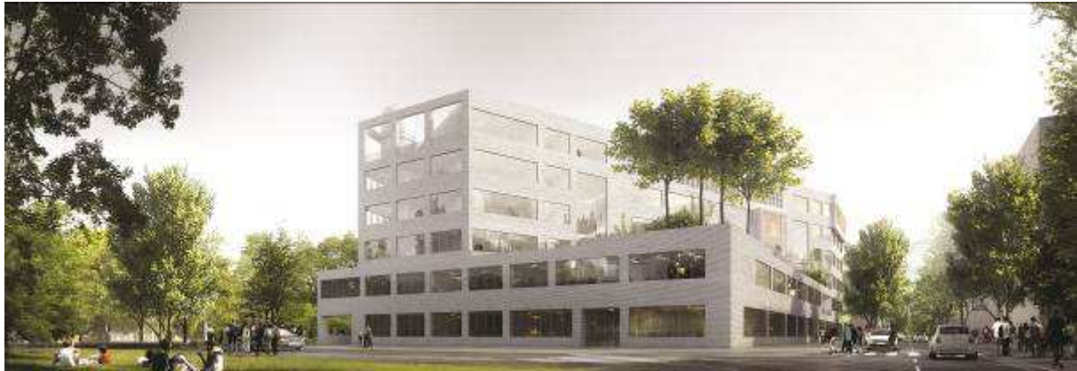
© Du Besset-Lyon / images : platform

Pratique et clairement organisé, le projet de Du Besset – Lyon concilie lieux d'études et de travail ainsi qu'espaces informels d'échange et de détente.