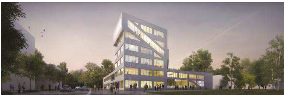
© Du Besset-Lyon / images : platform

La partie supérieure du projet n'impose ainsi pas une présence trop forte à son voisin Polytech Paris-Sud et dégage l'horizon sur le bois classé au sud, intégrant esthétiquement le bâtiment dans son environnement urbain et naturel. La continuité paysagère entre le parvis et la forêt est accentuée par la placette plantée, intégrée dans une découpe du socle du bâtiment, et une terrasse végétalisée. L'angularité du bâtiment singularisera celui-ci par rapport à son environnement immédiat et servira de repère au campus.