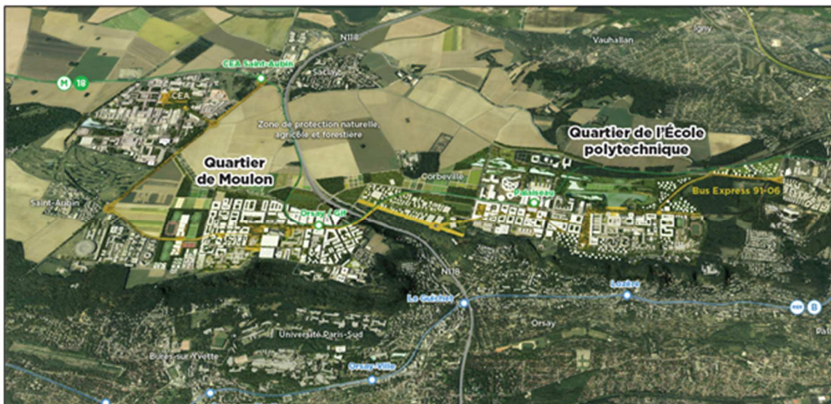
Le campus urbain Paris-Saclay – (Artefactory - EPA Paris-Saclay)

Le lauréat désigné à l'issue de la consultation sera titulaire d'un accord-cadre de maîtrise d'œuvre urbaine complet comprenant des missions d'urbaniste-coordonnateur de la ZAC, de maîtrise d'œuvre des espaces publics ainsi que d'accompagnement de l'EPA Paris-Saclay dans la définition du projet urbain, pour une durée de 6 ans.